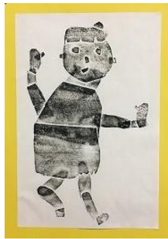
小学部4年 「スケートのポーズ」