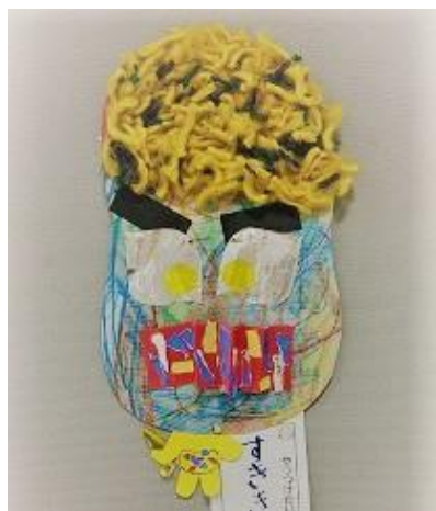
幼稚部3年 「すききらいおに」